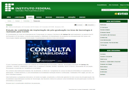
Figura 1: Notícia com a Consulta publicada no site do Campus Petrolina do IFSertãoPE.