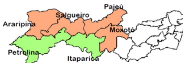
Figura 1. Sertão de Pernambuco - mesorregiões e microrregiões.

Inserido no semi-árido nordestino, o IFSertãoPE acaba fazendo parte de uma área que abrange de 64% do território Pernambucano. Possui duas mesorregiões e seis microrregiões (RELATÓRIO PROJETO POLÍTICO INSTITUCIONAL - PPI, 2015) conforme Figura 1 .