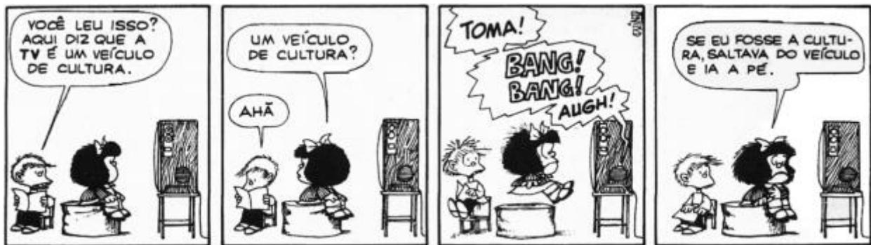
Quino, Mafalda 2. São Paulo: Martins Fontes, 2002.

04. No último quadrinho dessa tirinha de Quino, temos um uso inadequado dos verbos, segundo a norma padrão, mas comumente empregado na coloquialidade, o equívoco é: