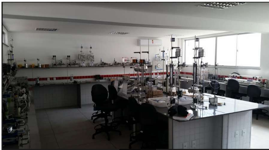
Figura 4 - Laboratório de Física do campus Serra Talhada.

O laboratório de Física (Figura 4) atenderá às necessidades das disciplinas de Física do eixo estruturante bem como as disciplinas de Metrologia, Termodinâmica, Transferência de Calor e Mecânica dos Fluidos. Os equipamentos que comporão o referido laboratório deverão atender às necessidades específicas abordadas nos tópicos das disciplinas, conforme ementa.