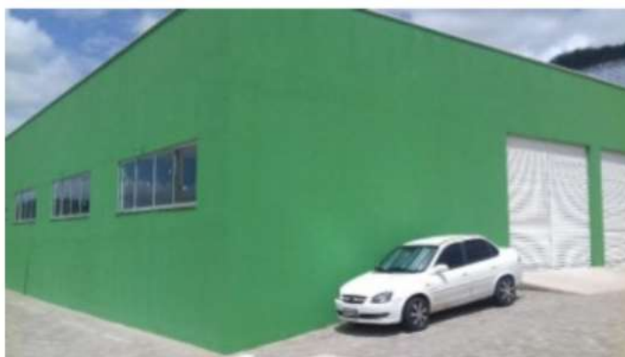
Figura 3 - Imagem posterior do prédio onde consta os laboratórios para aulas práticas.

O laboratório de Informática atenderá disciplinas técnicas as quais tenham a necessidade do suporte dessas instalações. O laboratório tem a capacidade de comportar um total de 40 alunos. Cada máquina é composta por CPU, monitor, mouse e teclado. Na opção da escolha de máquinas que contemplam a tecnologia all-in-one , será necessário apenas o computador, mouse e teclado.