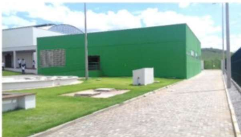
Figura 2 - Imagem frontal do prédio onde consta o bloco do laboratório de Refrigeração/Mecânica bem como do laboratório de Desenho Auxiliado por Computador.