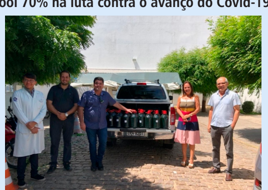
Doação à APAMI. A instituição estava com o estoque quase zerado. Foram doados 100L de álcool.

Em ação conjunta com as Vinícolas Terranova e Mandacaru, o IF Sertão-PE distribuiu quase mil litros de álcool à Secretaria de Desenvolvimento Social e Direitos Humanos de Petrolina (SEDESDH) e à Casa Anjo da Guarda, instituição que acolhe crianças e adolescentes em situação de risco ou vulnerabilidade social. Ainda foram beneficiados o Hospital Municipal de Lagoa Grande, a Secretaria de Saúde de Petrolina e a plataforma Transforma Petrolina, que visa ligar ONGs e projetos sociais que fazem trabalhos voluntários, no total, foram 14 ONGs beneficiadas do Transforma Petrolina, além da Associação Petrolinense de Amparo à Maternidade e à Infância (APAMI) e a Secretária de Saúde de Casa Nova (BA).