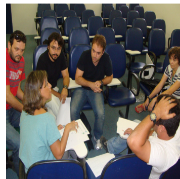
Ciclo de Palestras no campus Floresta