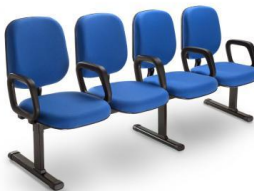
Imagem exemplificativa do item 3: